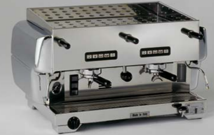
80 L 16M