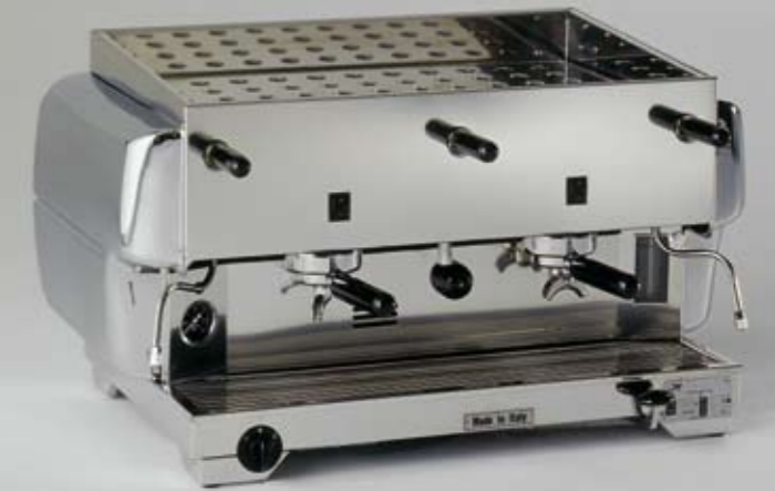
80 L 12